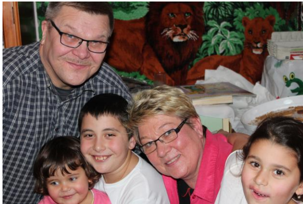
4 - Mezöberény