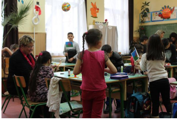
3 - Romani-kulttuurin päivä koulussa