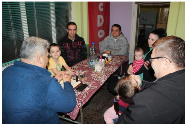
2 - Kotiryhmä